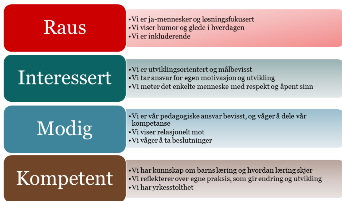
Figur 2: Oversikt over hva kommunens verdier betyr for barnehagens ansatte.

(Fra Kommuneplanens samfunnsdel 2015-2030)