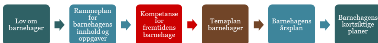
Figur 1: Planhierarki

Årsplanen er et arbeidsredskap for personalet og dokumenterer barnehagens valg og begrunnelser. Årsplanen kan også gi informasjon om barnehagens pedagogiske arbeid til myndighetsnivåene, barnehagens samarbeidspartnere og andre interesserte.